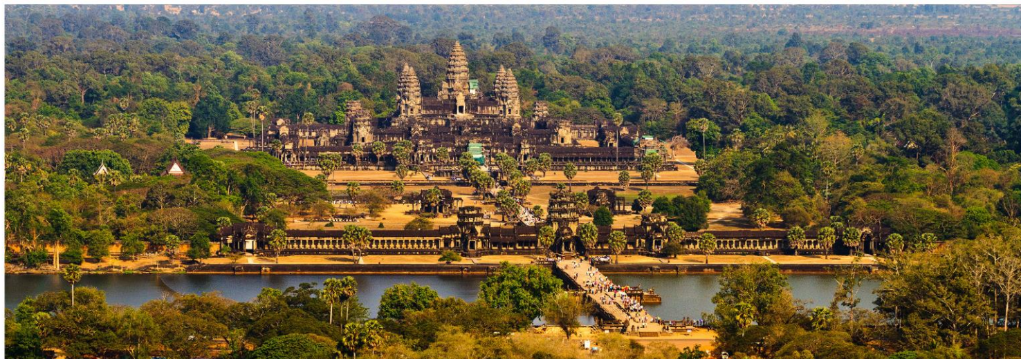
ANGKOR WAT